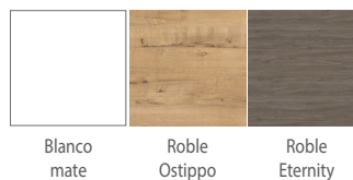
Blanco mate Roble Ostippo Roble Eternity